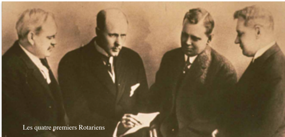
Les quatre premiers Rotariens