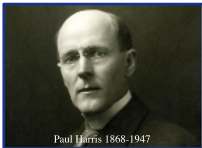
Paul Harris 1868-1947